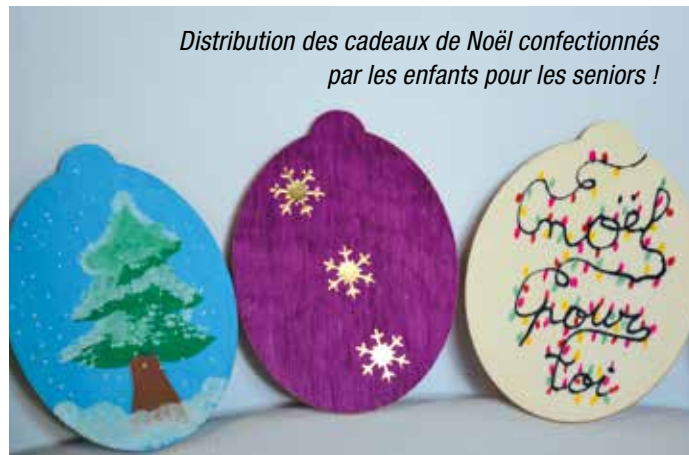
Distribution des cadeaux de Noël confectionnés par les enfants pour les seniors !