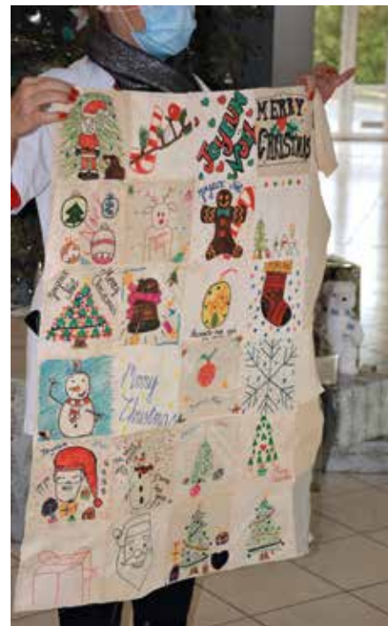
Patchwork géant avec des dessins sur tissu réalisés par les aînés pour les enfants !